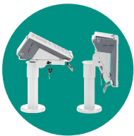
85° kippbar / 300° schwenkbar für schnelle und ergonomische Ausrichtung zum Benutzer

Die Terminalhalterungen für das ORGA 6141 online werden als Stand-Alone-Lösung fest am Kassentisch montiert. Sie sind mit einer robusten Pulverbeschichtung in weiß (RAL 9016) ausgestattet. Ohne den Standfuß kann die terminalspezifische Aufnahme auch als Komponente einer Komplettlösung der Firma ANKER Kassensysteme eingesetzt werden. Bei den ANKER Flexi-Stands handelt es sich um ein modulares Baukastensystem, aus dem Sie durch Auswahl einer großen Anzahl an Komponenten Ihre ganz individuelle Lösung zusammenstellen können. Diese modulare Technologieplattform umfasst eine Vielzahl einzelner Komponenten, wie z. B. Sockel, Arme und Verlängerungen in unterschiedlichen Längen, Druckerhalterungen, EFT-Halterungen, Kundenanzeigen oder Wandhalterungen. Weitere Informationen über die Kombinationsmöglichkeiten der Terminalhalterungen mit dem Flex-Stand System der Firma ANKER finden sie unter www.aks-anker.de .