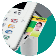
Alle Kartenslots sind einfach und komfortabel zugänglich.