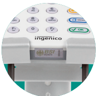
Überprüfung der Gehäuse- und Slot-Siegel problemlos möglich, ohne das Terminal aus der Halterung zu nehmen.