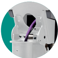
Unauffällige und geschützte Kabelführung vom Terminal durch die Halterung